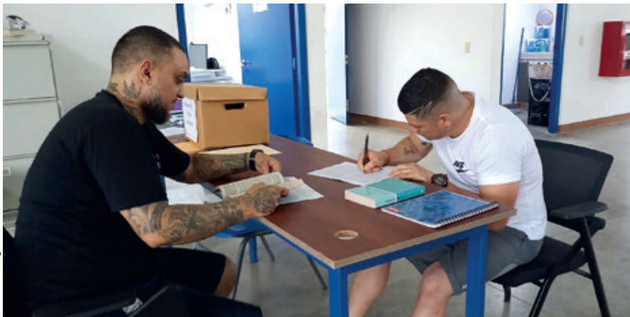
Zwei Häftlinge in einem Gefängnis in Costa Rica beschäftigen sich intensiv mit der Bibel.

Ähnlich wie die Bibelgesellschaft im Golf stellen viele Bibelgesellschaften Bibeln für Gefangene bereit und bringen diese entweder selbst in die Gefängnisse oder arbeiten mit Partnerorganisationen oder Gefängnis-seelsorgern zusammen. Die oft ehrenamtlichen Mitarbeitenden stehen für Gespräche zur Verfügung, feiern Gottesdienste, zeigen den Jesus-Film von »Campus für Christus« oder bieten Bibelkurse an. Ehemals Kriminelle finden so einen neuen Halt im Leben und erfahren eine tiefgreifende Veränderung, die sich auch positiv auf ihre Resozialisierung auswirkt.