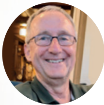
AUTOR HARTMUT SCHWARZ

ist Geschäftsführer der Oldenburgischen Bibelgesellschaft.