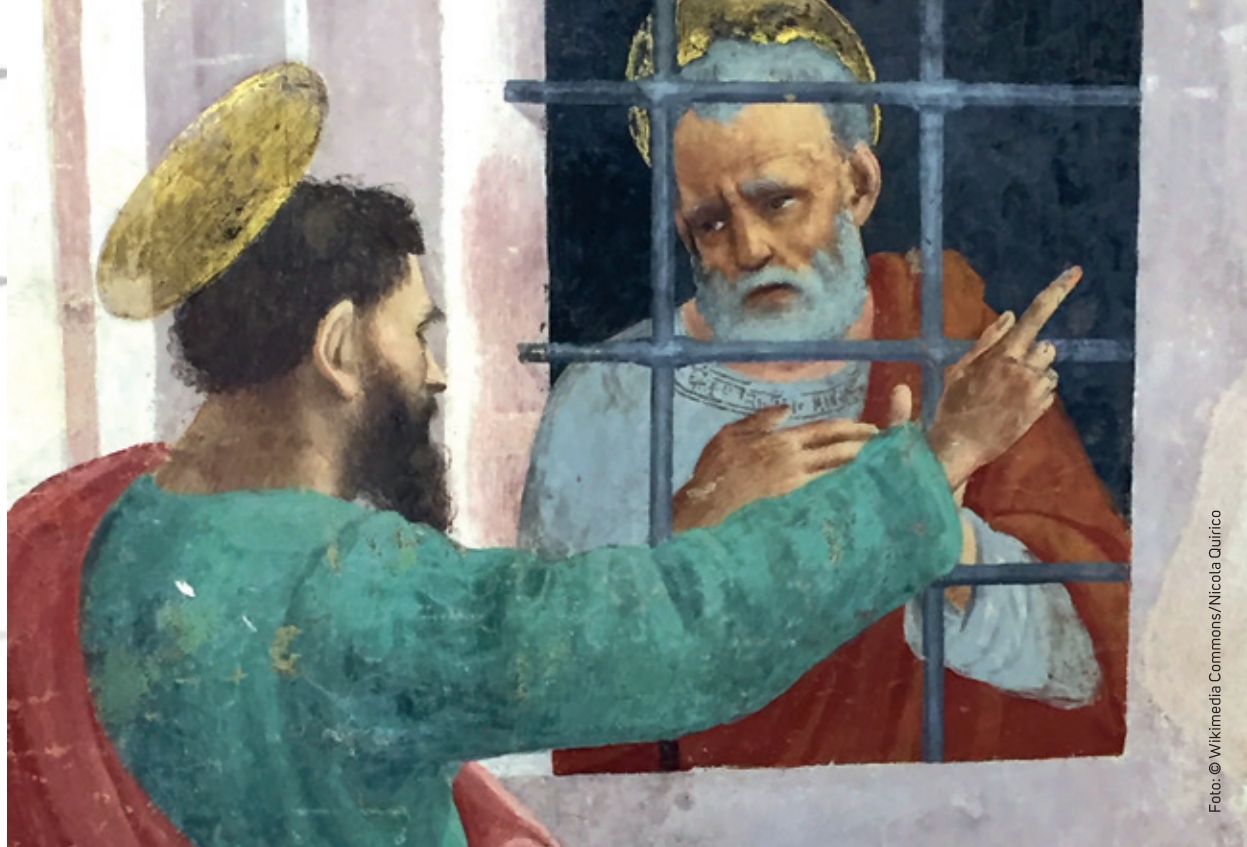
Paulus besucht Petrus im Gefängnis, Fresko von Filippino Lippi